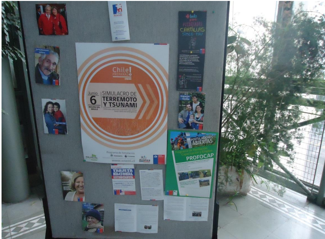
Afiche del programa ubicado en la Gobernación Provincial de Linares, Comuna de Linares, Región del Maule