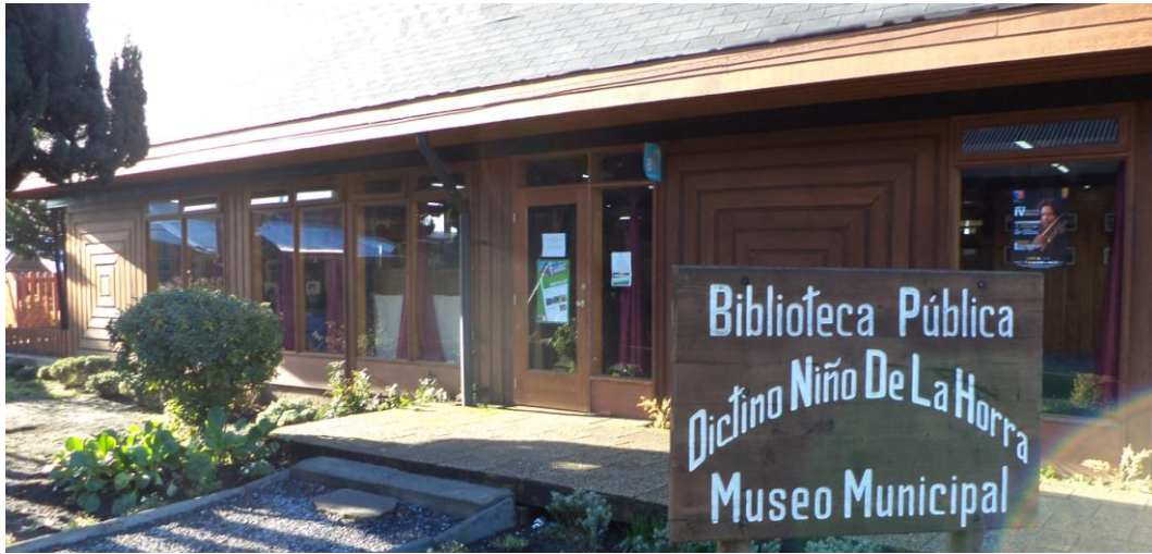
Afiche del programa al exterior de Biblioteca Pública de Villarrica, Comuna de Villarrica, Región de La Araucanía