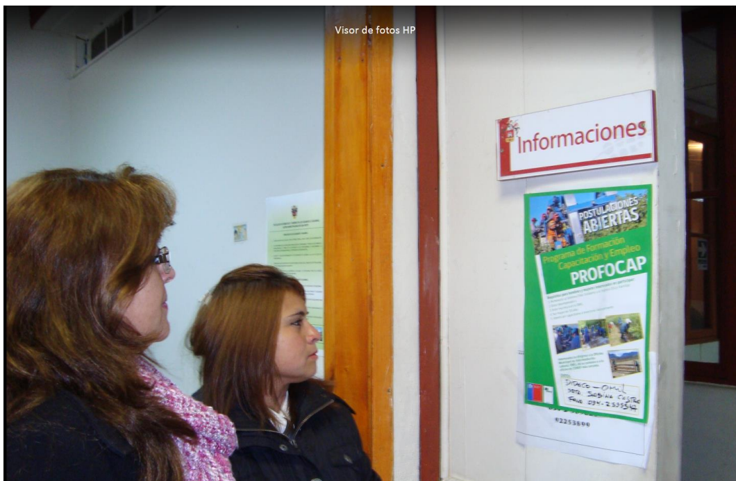
Potenciales usuarias observando afiche del programa, ubicado al exterior de la oficina de la Dirección de Desarrollo Comunitario, DIDECO, de la Ilustre Municipalidad de San Felipe, Región de Valparaíso