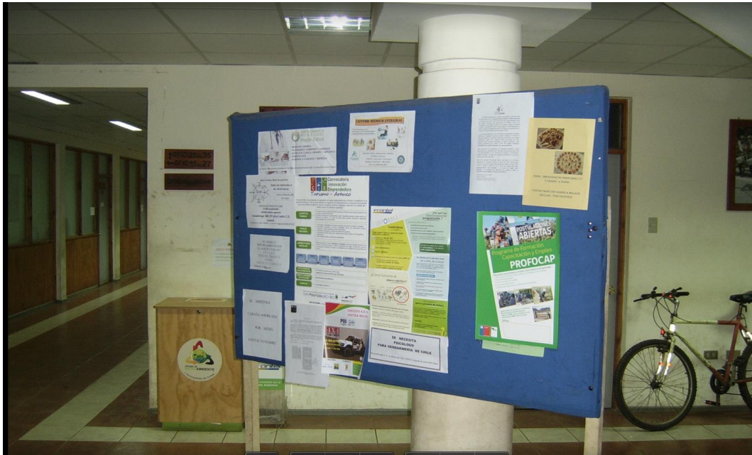
Afiche del programa en panel informativo de la Ilustre Municipalidad de Cañete, Región del Biobío