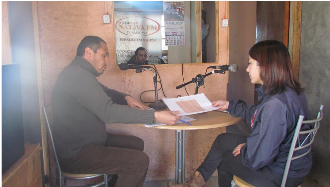
Difusión radial, por parte de jefe Técnico de Grupo, a través de emisora Radio Nativa FM, Comuna de Peralillo, Región del Libertador General Bernardo O'Higgins