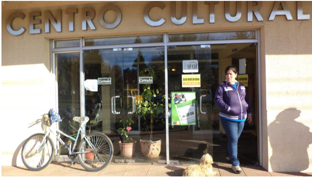
Afiche del programa al exterior de instalaciones del Centro Cultural de Perquenco, Comuna de Perquenco, Región de La Araucanía