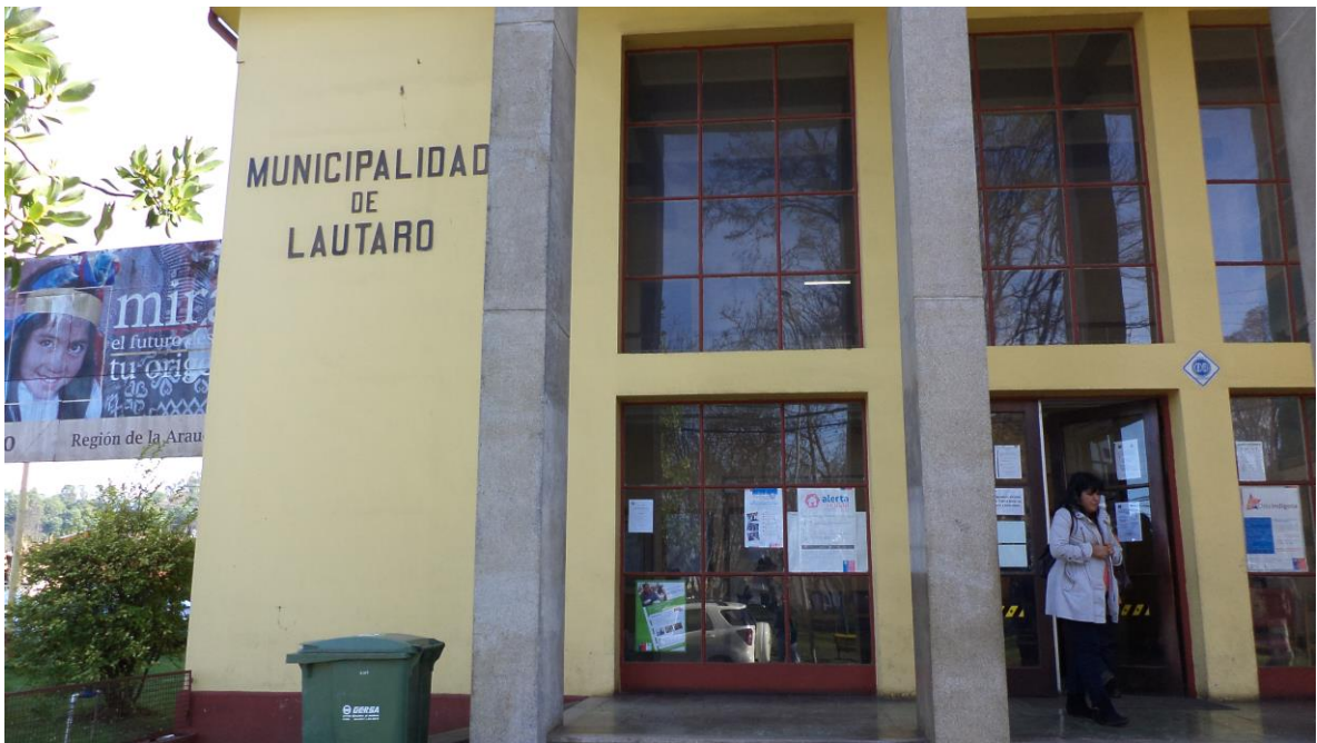
Afiche del programa al exterior de Ilustre Municipalidad de Lautaro, Comuna de Lautaro, Región de La Araucanía