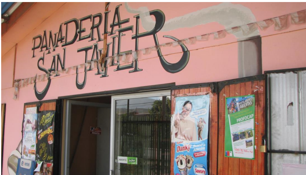
Afiche del programa al exterior de Panadería ubicada en la Villa San Rafael, Comuna de Illapel, Región de Coquimbo