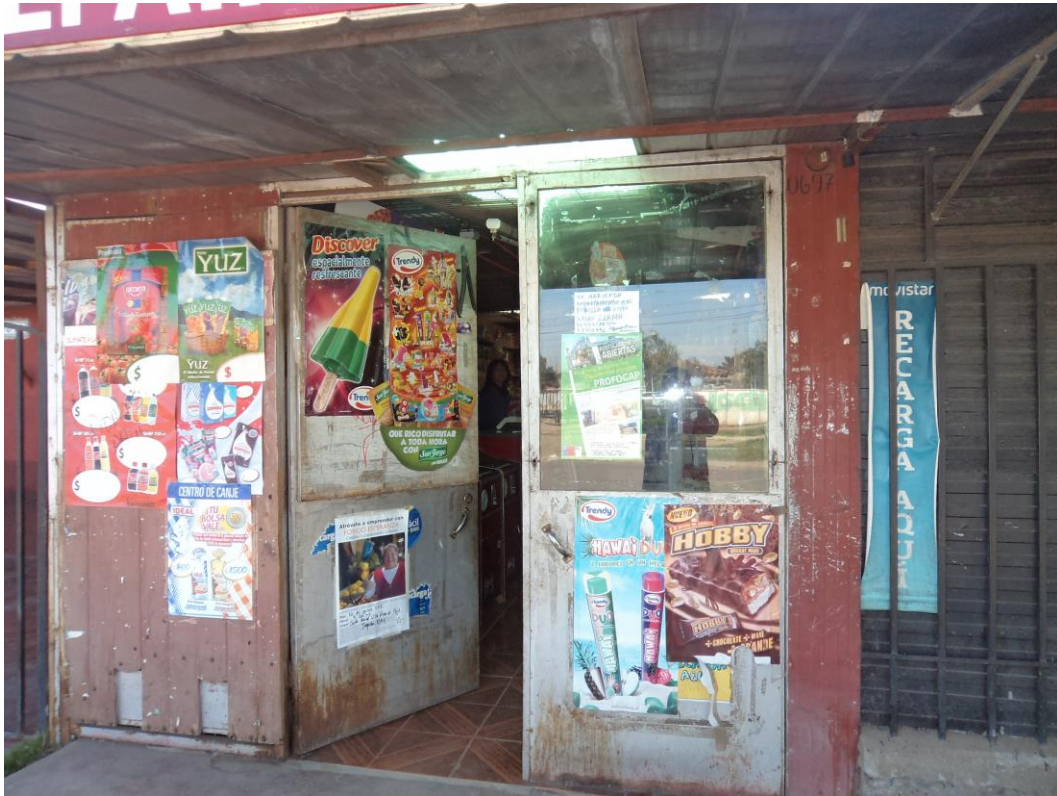
Afiche del programa al exterior de Almacén ubicado en la Población Costa el Sol, Comuna de Rancagua, Región del Libertador General Bernardo O'Higgins