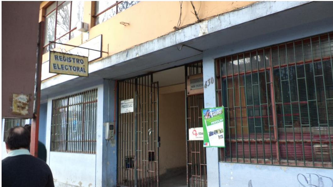
Afiche del programa al exterior de la Oficina OMIL, Comuna de Angol, Región de La Araucanía