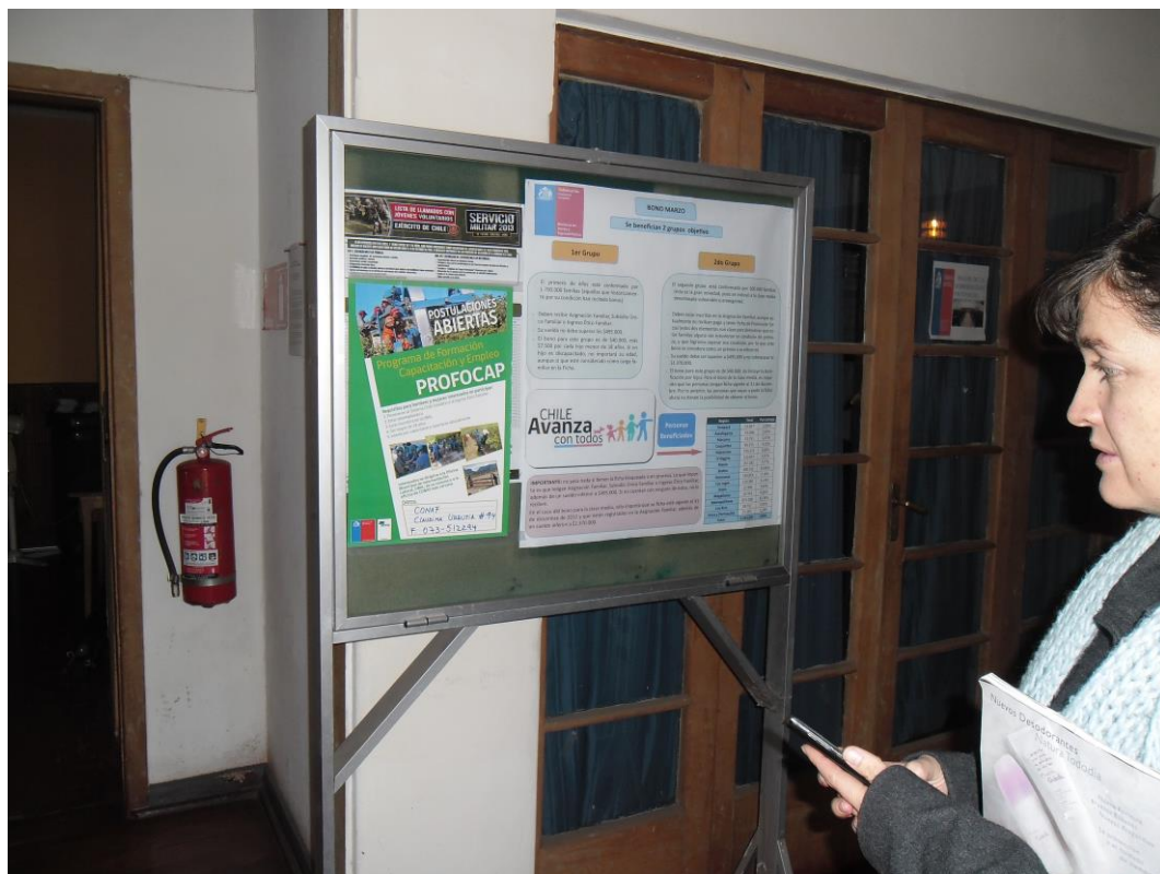
Afiche del programa ubicado en el interior de Gobernación Provincial de Cauquenes, Comuna de Cauquenes, Región del Maule