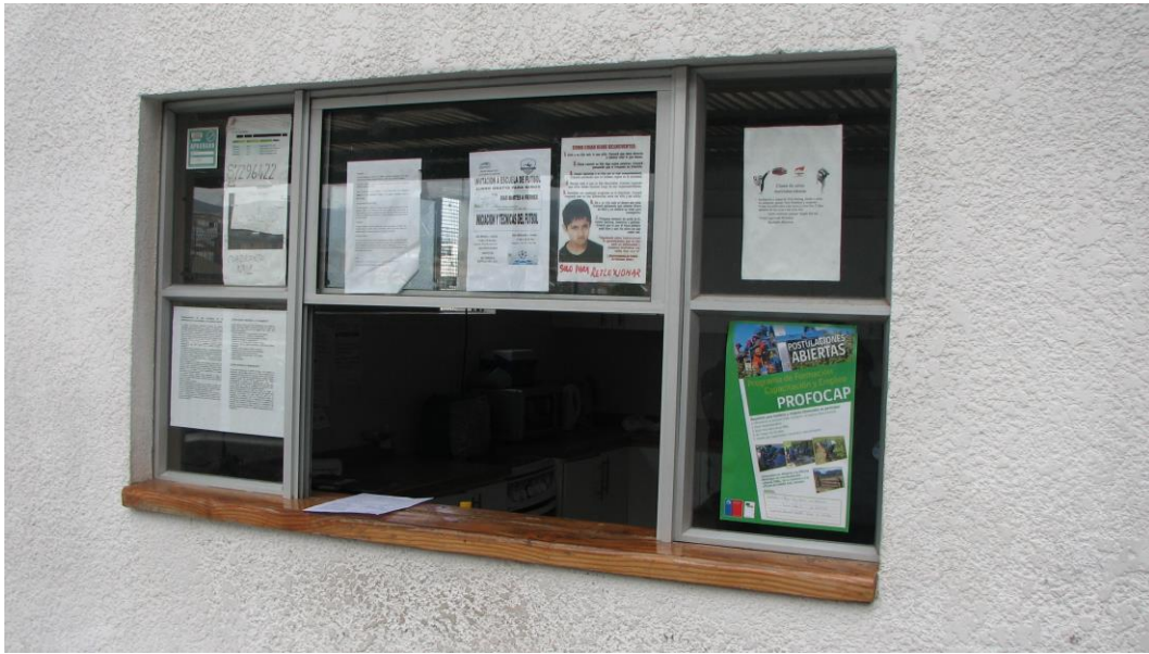
Afiche del programa en instalaciones del Parque del Sol – Las Compañías, Comuna de La Serena, Región de Coquimbo