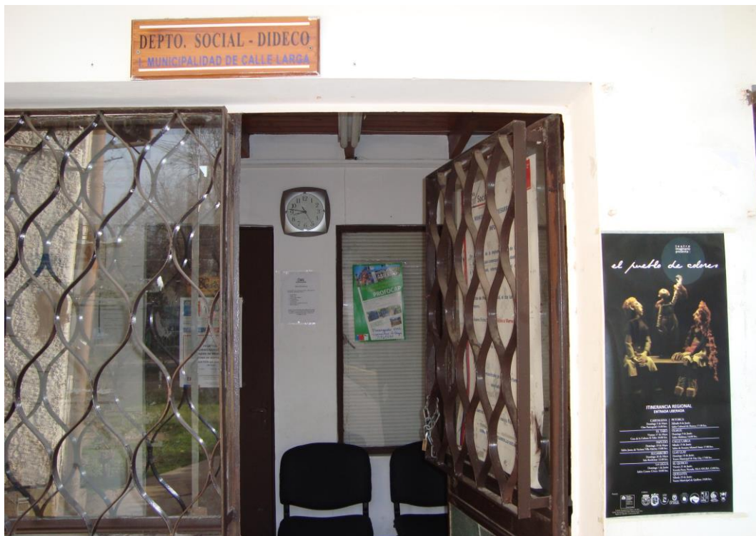
Afiche del programa al interior de oficinas del Departamento Social – DIDECO de la Ilustre Municipalidad de Calle Larga, Región de Valparaíso