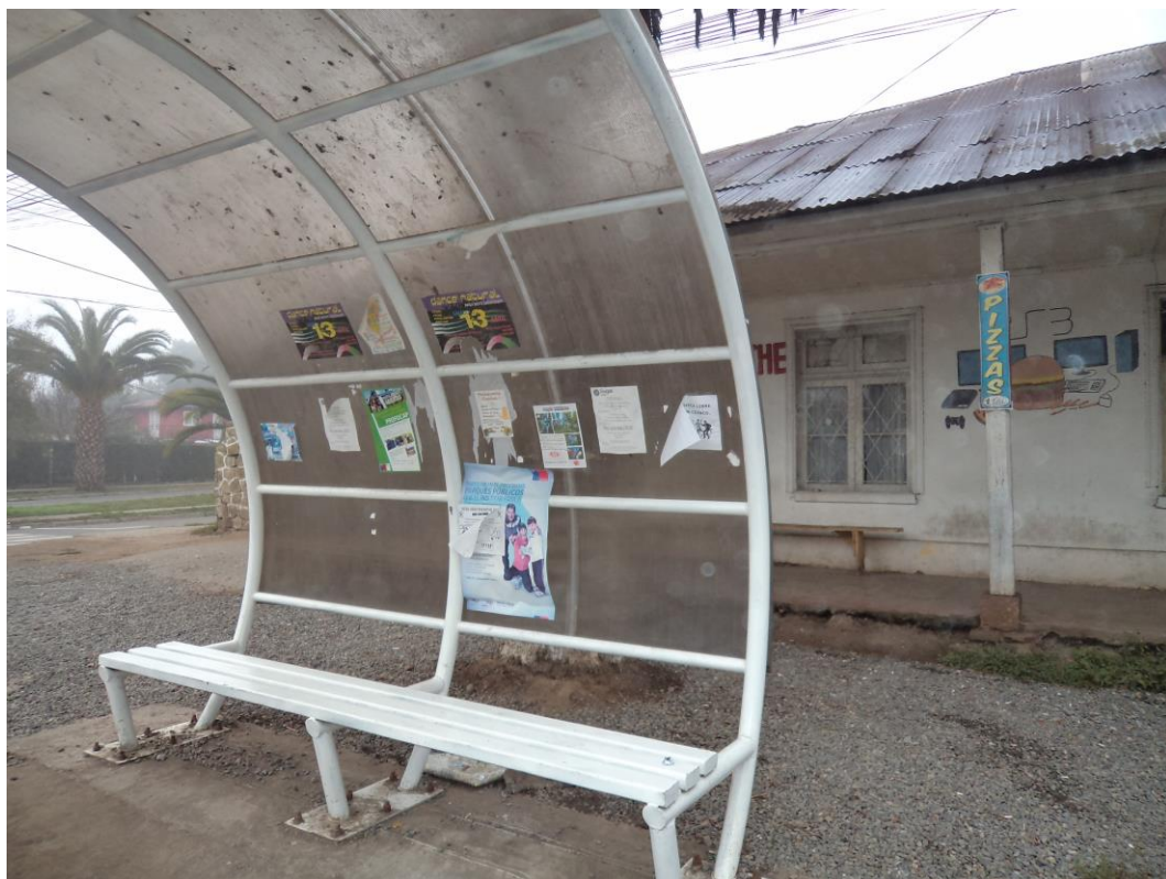
Afiche del programa ubicado en Paradero de la Plaza Guacargue, Comuna de Quinta de Tilcoco, Región del Libertador General Bernardo O'Higgins