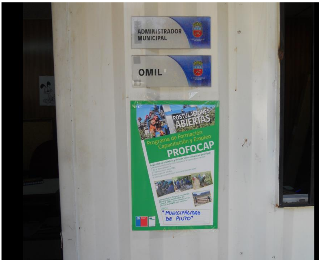
Afiche del programa al exterior de oficinas del Administrador Municipal de la Ilustre Municipalidad de Pinto, Región del Biobío