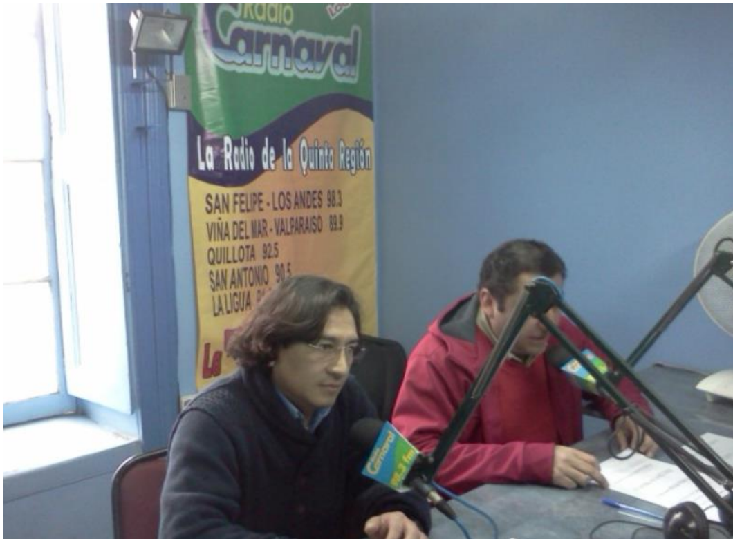
Difusión radial en la Región de Valparaíso, por parte de jefe Técnico de Grupo a través de emisora Radio Carnaval