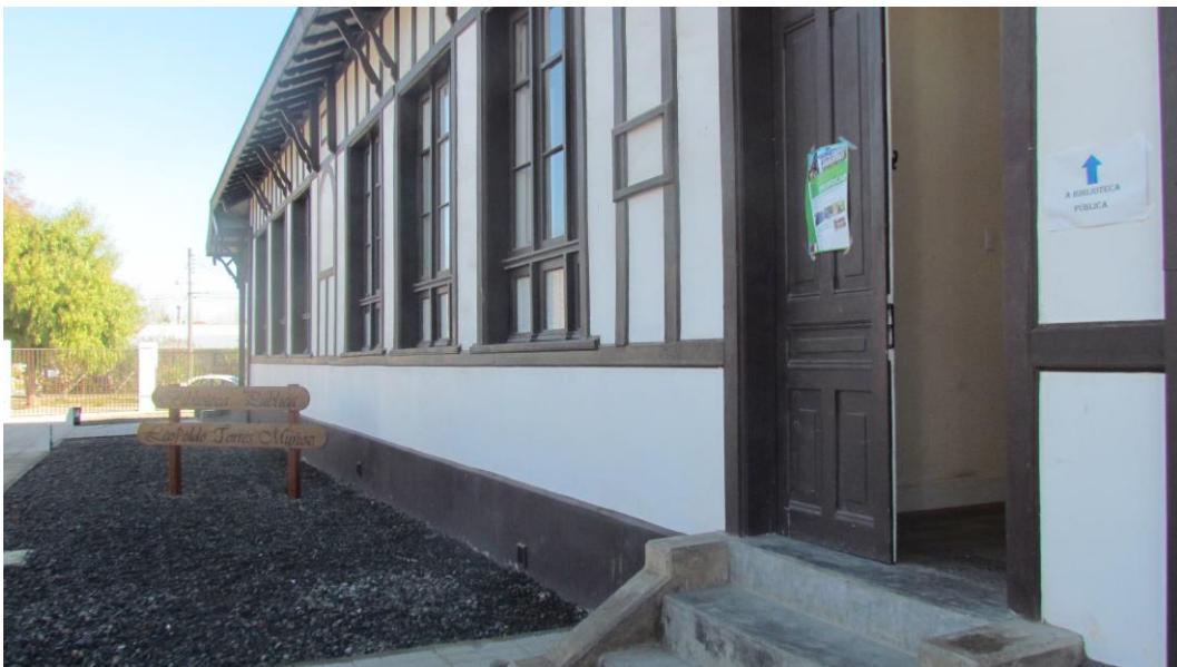
Afiche del programa en el acceso de Biblioteca Pública de Peralillo, Comuna de Peralillo, Región del Libertador General Bernardo O'Higgins