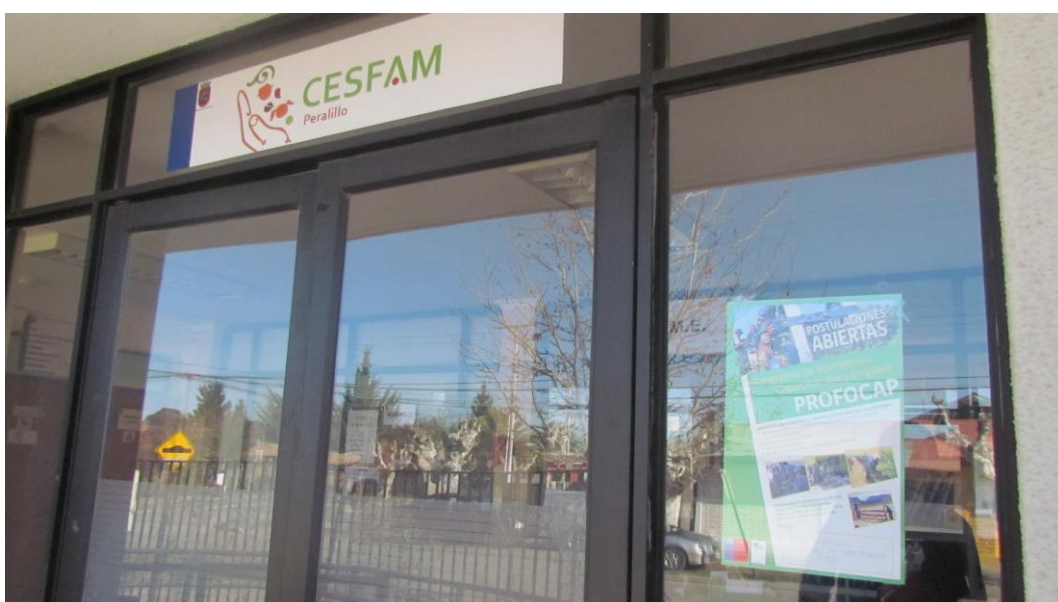
Afiche del programa ubicado en el Acceso al Centro de Salud Familiar, CESFAM de Peralillo, Comuna de Peralillo, Región del Libertador General Bernardo O'Higgins