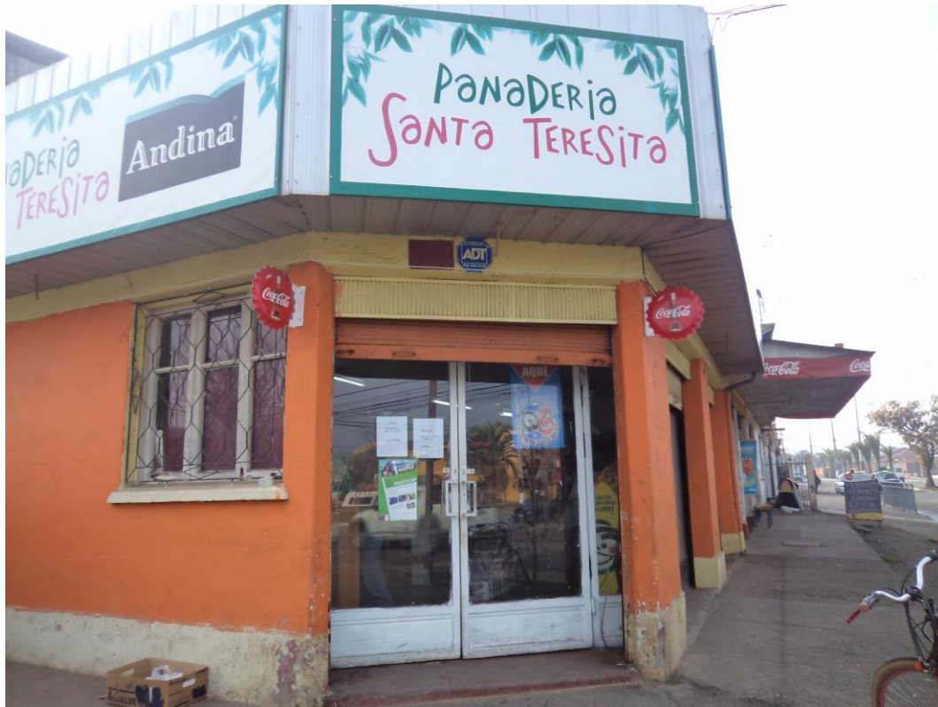
Afiche del programa ubicado en la entrada a Panadería en la calle Marsan, Comuna de Rengo, Región del Libertador General Bernardo O'Higgins