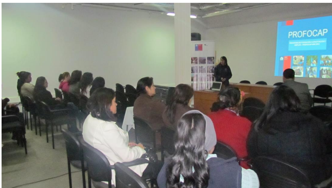
Presentación del Programa a potenciales usuarias en el Centro Cultural de Pichilemu, Comuna de Pichilemu, Región del Libertador General Bernardo O'Higgins