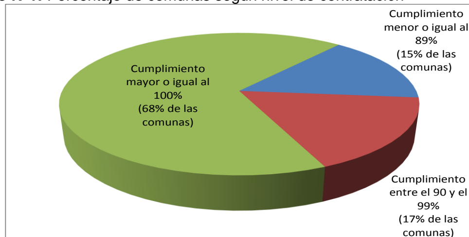
Gráfico N°1: Porcentaje de comunas según nivel de contratación

Al desagregar a nivel comunal el grado de contratación alcanzado, se puede señalar que: en 44 comunas la contratación igualó o superó el 100% de los cupos programados; en 11 comunas la contratación osciló entre el 90 y el 99% de los cupos y, en 10 comunas la contratación fue menor al 89% de los cupos programados. Situación que se ilustra, en forma relativa, en el gráfico N°1.